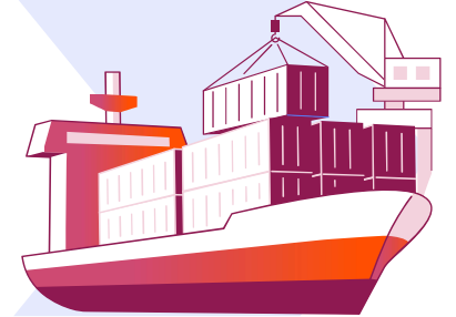
Nihai alıcılar (deniz taşımacılığında)