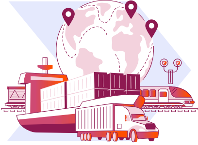
Denizler ve iç sular, kara yolları ve demir yollarında faaliyet gösteren nakliye şirketleri